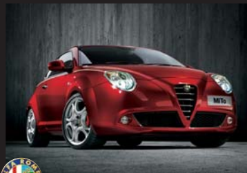
Alfa romeo MiTo