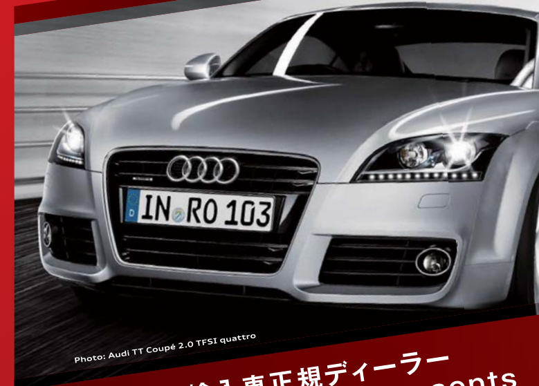
Photo: Audi TT Coupé 2.0 TFSI quattro