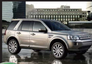
LAND ROVER Freelander2